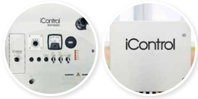
Cada panel se aloja en una caja de acero inoxidable.